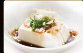
55. TOFU tofu con aceto di riso € 3,50