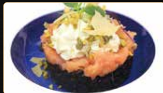
264. BLACK CAKE € 10,00 ciotola di riso venere coperto di tartar di salmone piccante avocado philadelphia sesamo tobiko