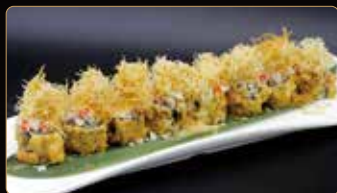
124. NIDO ROLL EBI avocado esterno fritto sopra tartar di gamberi cotti* maionese kataifi teriyaki € 10,00