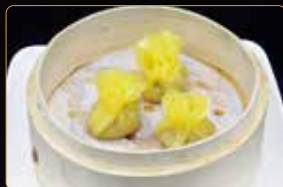
22. RAVIOLI DI TOTANO € 5,00