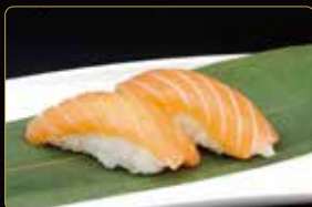
170. NIGIRI SAKE salmone crudo e riso € 3,00