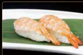
172. NIGIRI EBI gamberi* cotti e riso € 3,00