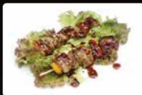
359. SPIEDINI DI MANZO spiedini di manzo condite con salsa yakiniku € 6,00