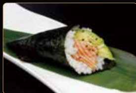
150. T. SAKE AVOCADO salmone crudo e avocado € 4,00