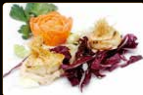
353. GUGLIE DI CAPESANTE capesante' alla piastra kataifi salsa della casa € 10,00