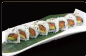
80. U. SAKE AVOCADO salmone avocado € 7,00