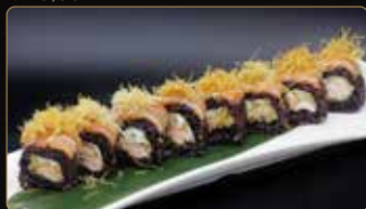
129. BLACK SAKE FRY salmone fritto philadelphia esterno salmone crudo kataifi teriyaki € 12,00