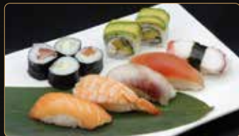
241. SUSHI MIX 5 nigiri, 4 hosomaki, 2 uramaki € 10,00