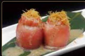
197. GIO NEW TUNA gamberi rossi* kataifi esterno tonno salsa sesamo € 5,00