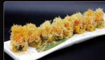
123. NIDO ROLL SALMONE avocado esterno fritto sopra tartar di salmone piccante kataifi teriyaki € 10,00