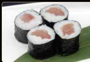
66. HOSOMAKI TEKKA € 4,00 tonno