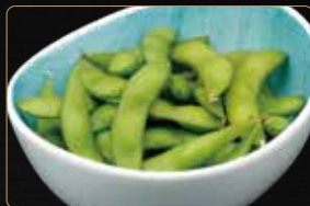
08. EDAMAME baccelli di soia € 4,00