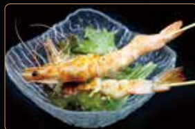
355. MAZZANCOLLE mazzancolle scottate condite con salsa yakiniku € 6,00