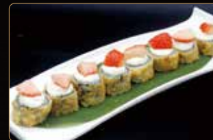
75. HOSOMAKI FRITTO CON FRUTTA € 6,00 salmone esterno fritto philadelphia teriyaki e fragole