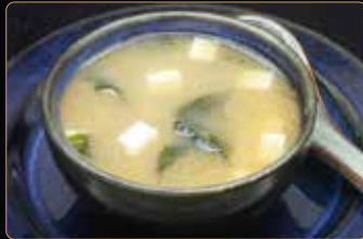
40. MISO SHIRU € 2,50 zuppa di soia con alghe e tofu