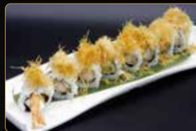
88. U. EBITEN gamberi* fritti maionese teriyaki sopra kataifi € 7,00