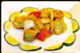
328. STUFFED PEPPERS peperone ripieno di tartar di gamberi*, surimi di granchio* e tofu € 10,00