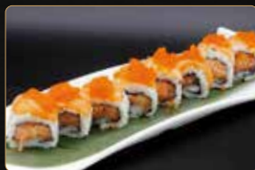
92. SAKE ROLL € 10,00 salmone tritato piccante maionese esterno salmone tobiko