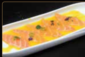
223. CARPACCIO PASSION FRUIT € 8,00 carpaccio di salmone con salsa passion fruit