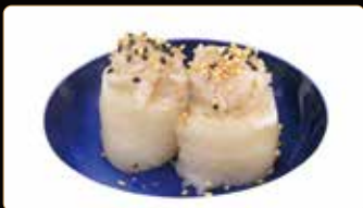
205. GIO WHITE € 5,00 tartar di ricciola e branzino, riso esterno ricciola