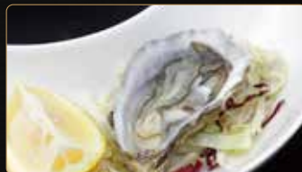
216. OSTRICA 1PZ € 3,00