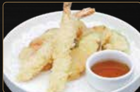
373. TEMPURA MISTA € 7,00 gamberi' e verdure miste in tempura