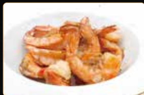
322. GAMBERI* SALE PEPE gamberi peperoni al sale e pepe € 6,00