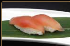
171. NIGIRI MAGURO tonno crudo e riso € 3,50