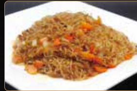
290. SPAGHETTI DI SOIA PICCANTE € 6,00 spaghetti di soia con carne e verdure piccante