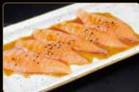
220. CARPACCIO SALMONE salmone salsa ponzu sesamo 5pz € 8,00