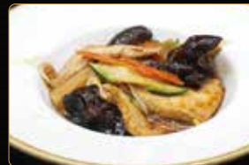
331. TOFU CON VERDURE MIX € 4,00