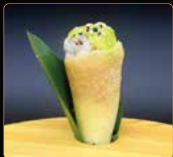
160. CROCK WHITE cono croccante con tartare di branzino, ricciola e salsa guacamole € 5,00