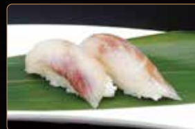
173. NIGIRI SUZUKI branzino crudo e riso € 3,00