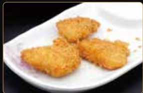
370. TORI NO KARAAGE pollo fritto € 4,50