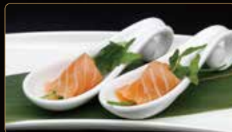
207. GIO RUCOLA € 4,00 rucola esterno salmone salsa ponzu