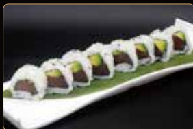
81. U. TONNO AVOCADO tonno avocado € 7,00