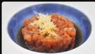
271. TARTAR DI TONNO tonno tritato piccante avocado tobiko kataifi salsa ponzu sesamo € 9,00