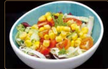
52. INSALATA MISTA € 3,50