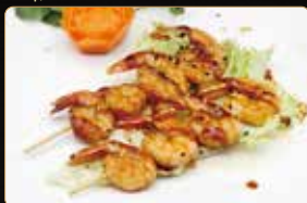
357. SPIEDINI DI GAMBERI' € 6,00