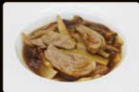
316. ANATRA BAMBÙ E FUNGHI € 6,00