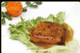
351. SALMONE ALLA GRIGLIA € 8,00