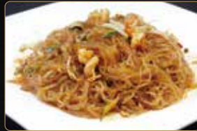
289. SPAGHETTI DI SOIA spaghetti di soia con gamberi* e verdure € 6,00