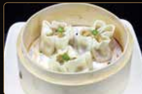
28. SHAOMAI € 4,00 ravioli di gamberi con carne, piselli e carote