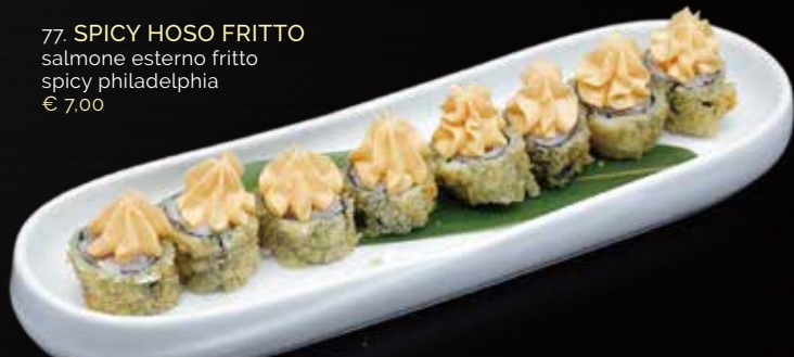
77. SPICY HOSO FRITTO salmone esterno fritto spicy philadelphia € 7,00