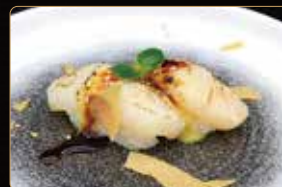
181. NIGIRI HOTATE capesante scottato, pasta kataifi e salsa teriyaki € 5,00