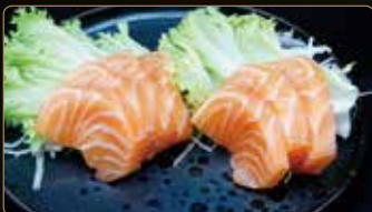
210. S. SAKE 6pz salmone € 6,00