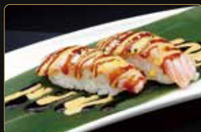
179. NIGIRI SAKE FLAMBÈ salmone scottato con salsa teriyaki, crema di soia € 4,00