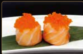
195. GIO TOBIKO tobiko riso esterno salmone € 4,00