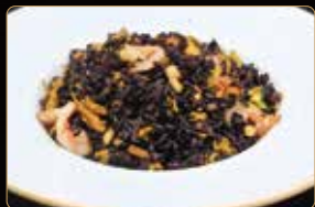
303. RISO VENERE € 7,00 riso venere saltato con verdure, gamberi* e uova