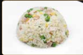
300. RISO CANTONESE riso saltato con prosciutto cotto, piselli, uovo € 5,00