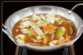
342. SCODELLA DI POLLO E VERDURE MISTE € 7,00