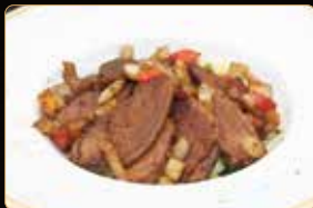
317. ANATRA SALE E PEPE € 6,00