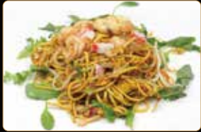
282. SPAGHETTI WENZHOUNESE € 7,50 spaghetti di grano tipici wenzhounese con gamberi, frutti di mare e verdure miste