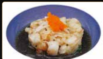
272. TARTAR AMAEBI tartar di gamberi crudi* con alghe picanti e salsa wasabi sesamo € 10,00