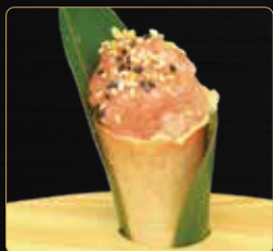
162. CROCK SALMON cono croccante con tartare di salmone e avocado € 5,00