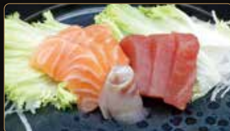
211. S. MISTO 6pz salmone branzino tonno € 7,00