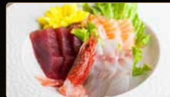
213. S. MISTO CON AMAEBI 7pz salmone branzino tonno gambero mazara* € 8,00