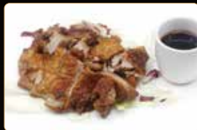
318. ANATRA FRITTO € 6,00