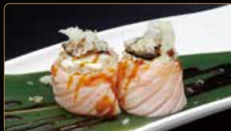
206. GIO TARTUFO € 5,00 philadeldia carpaccio di tartufo pastella di tempura esterno salmone scottato teriyaki