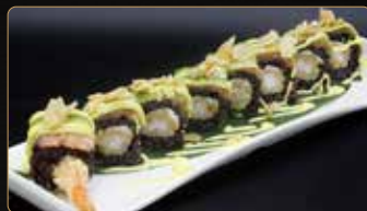
130. BLACK EBITEN gamberi* fritti philadelphia esterno tartar di salmone piccante avocado mandorle teriyaki maionese € 13,00