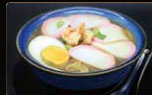
280. RAMEN KAISEN spaghetti ramen in brodo con misto di mare*, uova e verdure € 5,00