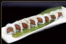
87. U. SPICY TUNA tonno tritato piccante € 7,00