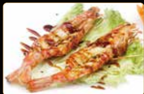
350. GAMBERONI' ALLA GRIGLIA € 8,00