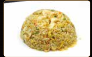
302. RISO GAMBERI E CURRY riso saltato con gamberi*, uova e salsa curry € 5,00