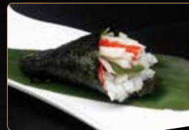
155. T. CALIFORNIA € 4,00 surimi di granchio* avocado cetriolo maionese