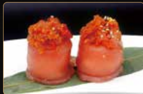
196. GIO SPICY TUNA tartar di tonno piccante riso esterno tonno € 5,00