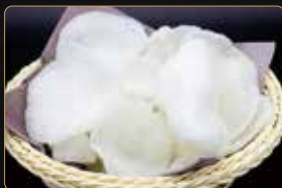
12. NUVOLE DI DRAGON chips di gmaberi € 2,00