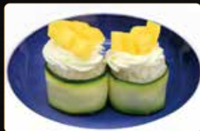
200. GIO ZUCCHINE MANGO philadelphia mango riso, zucchini esterno € 4,00