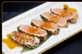
360. SALMONE TATAKI € 8,00 salmone scottato sesamo salsa tataki