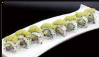
103. WHITE ROLL tartare di branzino e ricciola avocado esterno salsa guacamole € 12,00