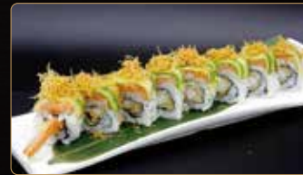
112. TIGER SPECIALE gamberi* fritti maionese esterno tartar di salmone avocado kataifi teriyaki € 12,00