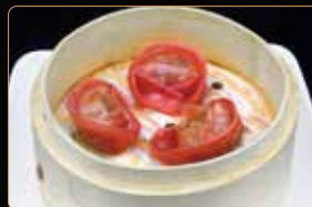
23. RAVIOLI DI MANZO € 5,00