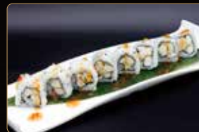
89. U. TORI pollo fritto maionese € 7,00