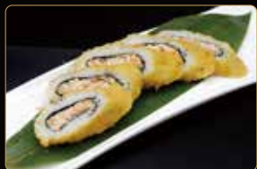
140. FUNKY ROLL salmone cotto philadelphia esterno fritto teriyaki salsa di casa € 8,00