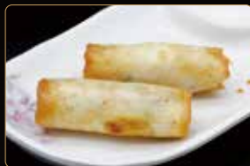
03. INVOLTINI VIETNAMITI involtini con carne, verdure mix e spaghetti di soia 2pz € 3,50