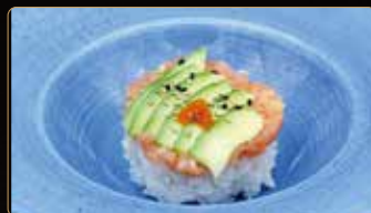
262. ZORI CHIRASHI € 14,00 ciotola di riso coperto di tartar salmone piccante avocado sesamo