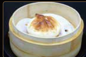
29. BAO ALLA PIASTRA bao alla piastra con maialino caramellato € 5,00