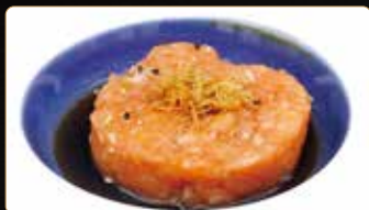
270. TARTAR DI SALMONE salmone tritato piccante avocado tobiko kataifi salsa ponzu sesamo € 8,00