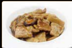
319. VITELLO CON BAMBÙ E FUNGHI € 7,00