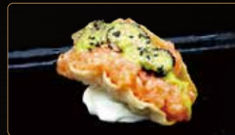
231. TACOS TARFUTO € 6,00 tartar di salmone, carpaccio di tartufo e salsa guacamole