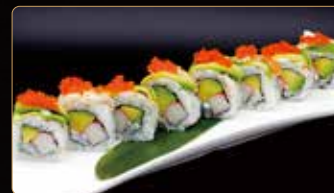
116. KANIMAKI surimi di granchio* avocado maionese esterno philadelphia gamberi cotti* avocado tobiko € 14,00