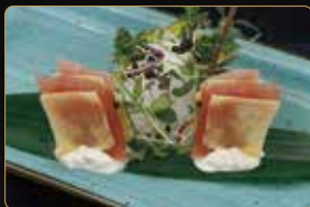
07. MAGURO MILLEFOGLIE sfoglia croccante con tonno, philadelphia e salsa tartufato € 12,00