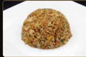
301. RISO SPECIALE CON MANZO € 5,00 riso saltato con manzo tritato, peperone, cipolla, zenzero, uova e verdure miste