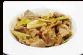
320. VITELLO CIPOLLOTTO vitello saltato con zenzero e cipollotto € 7,00