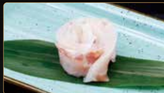
212. S. PESCE BIANCO 6pz branzino € 6,00