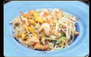
291. PAD THAI € 7,00 tagliatelle di riso saltate con gamberi*, verdure mix e scaglie di mandorle