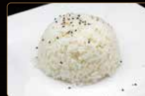
307. GOHAN € 2,50 riso bianco con sesamo