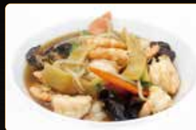
325. GAMBERI* E VERDURE MISTE € 6,00