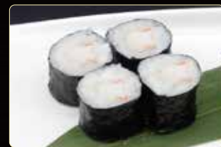
67. HOSOMAKI EBI gamberi' cotti € 4,00