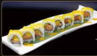
110. MANGO ROLL salmone mango esterno philadelphia mango € 12,00