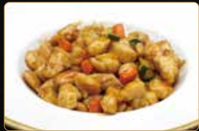
310. POLLO ALLE MANDORLE € 6,00 pollo verdure mandorle