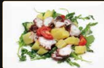
56. POLIPO CON PATATE € 7,00 insalata di polipo* con patate al vapore, condite con prezzemolo aceto e olio evo