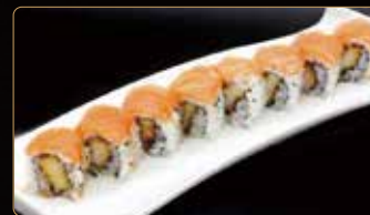
102. HOTATE capasanta in tempura esterno salmone crema di miso € 12,00