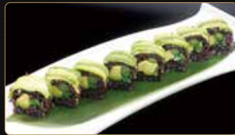
134. BLACK VEGANO avocado asparago gomawakame esterno avocado € 10,00