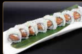
84. U. PHILADELPHIA salmone crudo con philadelphia € 7,00