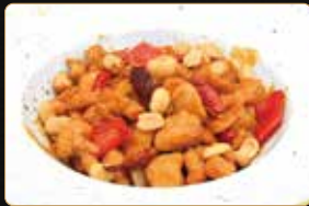
311. POLLO GONGBAO pollo verdure piccante € 7,00