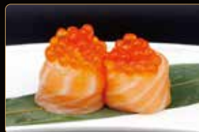
193. GIO IKURA uova di salmone riso esterno salmone € 5,00