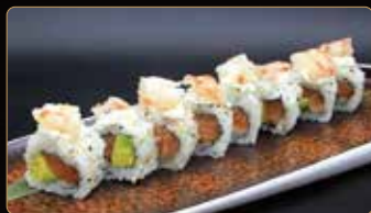
95. AMAEBI ROLL salmone avocado esterno philadelphia gamberi crudi* € 10,00