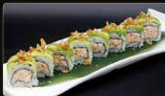
104. CRISPY MIURA MAKI salmone cotto e philadelphia esterno avocado cipolle fritte e teriyaki € 10,00