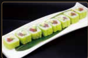
144. GREEN ROLL tonno avocado philadelphia esterno foglia di soia € 10,00