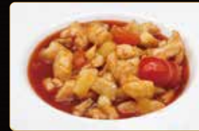
314. POLLO AGRODOLCE pollo pomodoro ananas salsa agrodolce € 6,00