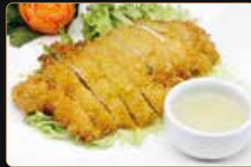
312. POLLO AL LIMONE pollo fritto con salsa limone € 6,00