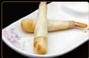
01. EBIHARUMAKI* involtini con gamberi e verdure mix 2pz € 4,00