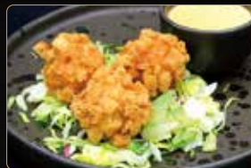
09. POLPETTE DI GAMEBRI CON MANDORLE* € 6,00