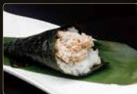
157. T. MIURA € 4,00 salmone cotto philadelphia teriyaki