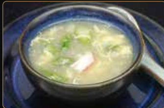
42. ZUPPA DI GRANCHIO CON ASPARAGI € 3,50 zuppa di polpa di granchio con asparagi e uova