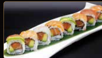
120. RAINBOW salmone avocado esterno pesce mistoe avocado € 10,00