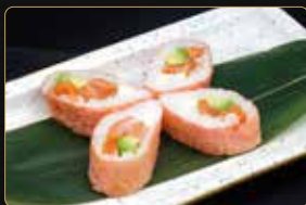
145. PINK ROLL salmone avocado papaya philadelphia esterno foglia di soia € 10,00