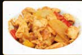
313. POLLO AL CURRY pollo con verdure al salsa curry € 6,00