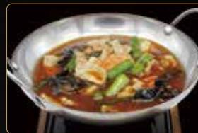
343. SCODELLA DI MANZO E VERDURE MISTE € 7,00