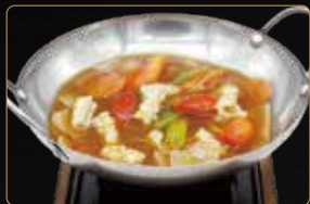
340. SCODELLA DI CALAMARI* E VERDURE MISTE € 7,00