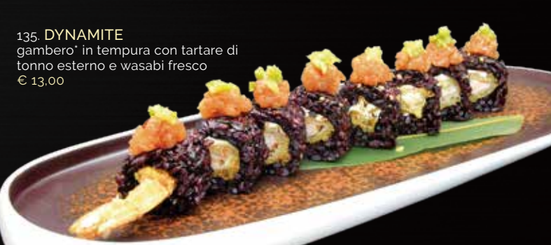
135. DYNAMITE gambero* in tempura con tartare di tonno esterno e wasabi fresco € 13,00