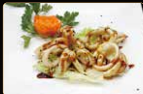
352. CALAMARI' ALLA GRIGLIA € 8,00