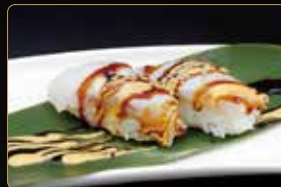
176. NIGIRI SUZUKI FLAMBÈ branzino scottato con salsa teriyaki, crema di miso € 4,00