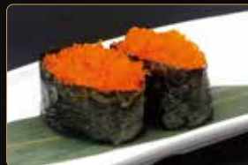
203. GUNKAN TOBIKO tobiko riso esterno alga € 4,00