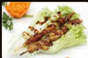
358. SPIEDINI DI POLLO € 5,00