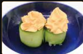
201. GIO ZUCCHINE SPICY PHILADELPHIA spicy philadelphia riso esterno zucchini € 5,00