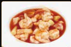
324. GAMBERI* AGRODOLCE gamberi pomodorini ananas in salsa agrodolce € 6,00