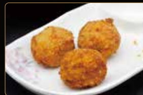
10. CROCCHETTE DI PATATE E SALMONE* € 5,00