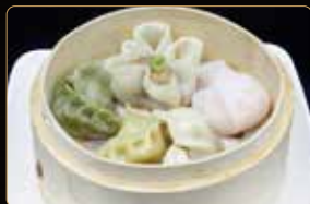
20. RAVIOLI MISTI € 5,00 composto da raviolo di carne, di gamberi, di salmone, di verdure e shaomai