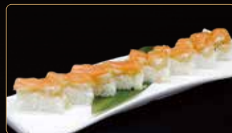
127. SAUDADE EBIFRAI rettangolo di riso guarniti di gamberi* fritti e salmone teriyaki € 10,00