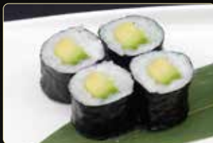
68. HOSOMAKI AVOCADO € 3,50