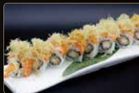
93. TIGER ROLL € 10,00 gamberi* fritti maionese esterno salmone kataifi e salsa teriyaki