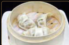
25. GYOZA* € 3,50 ravioli di carne al vapore