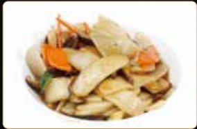
292. GNOCCHI DI RISO gnocchi di riso con verdure e gamberi* € 7,00