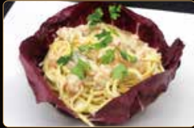
283. SPAGHETTI FRUTTI DI MARE CON PANNA € 7,50 spaghetti wenzhounese con pesce e gamberi, panna