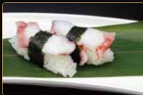
174. NIGIRI TAKO polipo* cotto e riso € 3,00