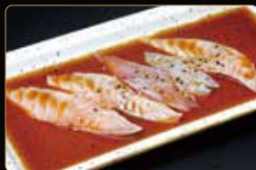
222. CARPACCIO SCOTTATO salmone scottato salsa ponzu cipolline e sesamo € 8,00