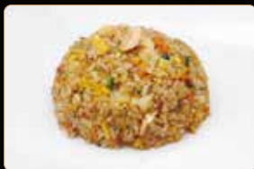
304. RISO GAMBERI E ANANAS € 5,00 riso con gamberi* uova ananas e aroma shacha