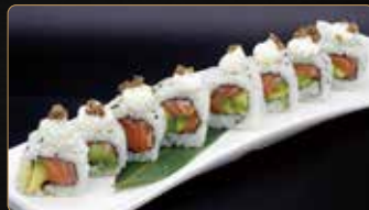
125. TARTUFO ROLL salmone avocado esterno philadelphia e salsa tartufo € 10,00