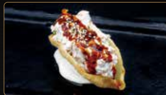
230. TACOS MIURA € 6,00 salmone cotto philadelphia avocado salsa teriyaki sesamo