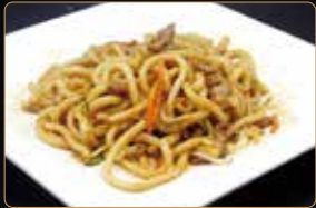
287. NIKU YAKI UDON spaghetti di grano grosso con manzo e verdure € 7,50