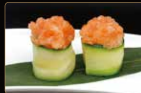
199. GIO ZUCCHINE SALMONE tartar di salmone riso esterno zucchini € 4,00