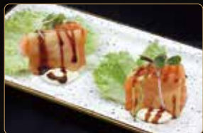
06. SAKE MILLEFOGLIE sfoglia croccante con salmone, philadelphia e glassa al balsamico € 10,00