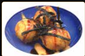
11. TAKOYAKI* polpette di verdure e polipo € 5,00