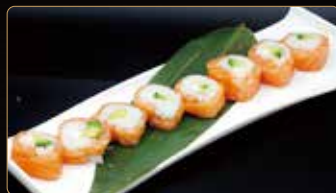
126. FRESH ROLL avocado philadelphia esterno salmone € 10,00