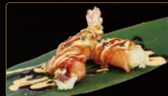
208. GIO EBITEN € 4,00 gamberi* fritti esterno salmone salsa spicy maionese teriyaki