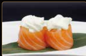
191. GIO PHILADELPHIA philadelphia, riso, salmone esterno € 4,00