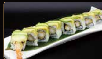
106. EBI DRAGON ROLL gamberi* fritti maionese esterno avocado e salsa teriyaki € 10,00