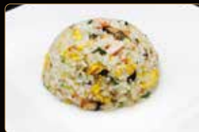
305. RISO CON FRUTTI DI MARE € 6,00 riso con frutti di mare e verdure uova saltato