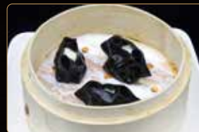
24. RAVIOLI DI CALAMARI € 5,00