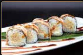
143. FUTOMORI tonno cotto philadelphia esterno salmone scottato fior di zucca fritto teriyaki € 10,00