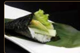
156. T. VEGETARIANO € 4,00 insalata avocado cetriolo