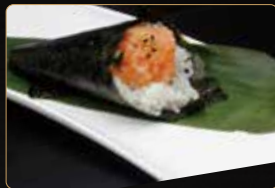
153. T. SPICY SAKE € 4,00 tartar di salmone piccante