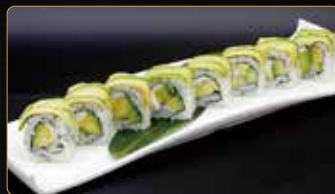
105. U. AVOCADO PHILADELPHIA avocado philadelphia esterno avocado € 9,00