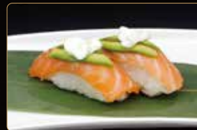
177. SAKE PLUS salmone avocado e phialdelfia € 3,50