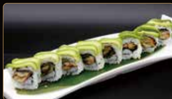
114. DRAGON ROLL anguilla* esterno avocado teriyaki € 12,00