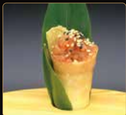
161. CROCK TUNA cono croccante con tartare di tonno e tobiko* € 5,00