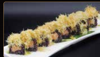
132. BLACK SPICY SAKE tartar di salmone piccante esterno kataifi salsa mango € 9,00