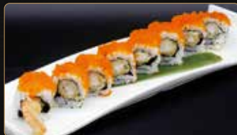
122. MOSHI MOSHI gamberi* fritti maionese esterno tobiko € 10,00