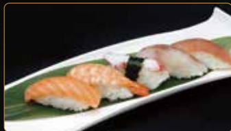
240. NIGHIRI MIX 5PZ 5 nigiri € 7,00