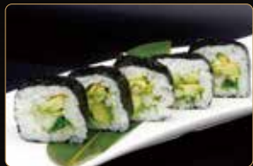
142. FUTOMAKI VEGETARIANO insalata cetriolo avocado € 6,00