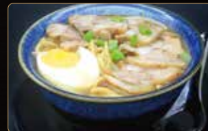
281. RAMEN BEEF spaghetti ramen in brodo con manzo, uova e verdure € 5,00