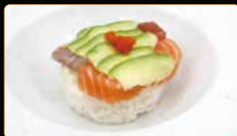
261. CHIRASHI MISTO € 14,00 ciotola di riso coperto di salmone branzino tonno avocado sesamo