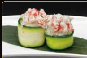
198. GIO ZUCCHINE gamberi cotti* maionese e riso esterno zucchini € 4,00