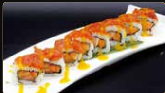
121. SOFI ROLL salmone papaya philadelphia esterno tartar di tonno piccante salsa mango € 12,00