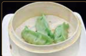
27. RAVIOLI DI VERDURE ravioli con verdure mix € 3,00