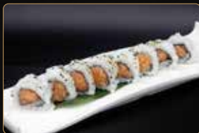
86. U. SPICY SAKE salmone tritato piccante, maionese € 7,00