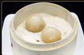
32. TANG BAO € 5,00 bao con carne e brodo