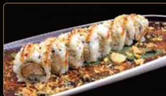
101. MAGURO PHILA tonno cotto philadelphia cipolla fritta e salsa teriyaki € 9,00