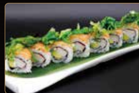
94. CRAB ROLL € 10,00 surimi di granchio* avocado philadelphia esterno salmone e alghe piccanti