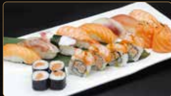
242. SUSHI SPECIALE € 20,00 8 nigiri, 4 uramaki, 4 hosomaki, 2 gunkan