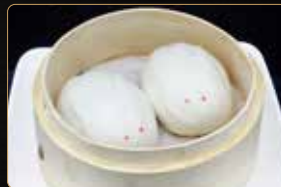
33. PANE USAGI € 3,00 pane in latte con crema all'uovo al vapore