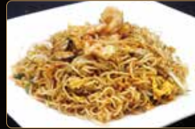
285. YAKI RAMEN spaghetti ramen saltati con gamberi* e verdure € 6,00