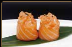
190. GIO SPICY SAKE tartar di salmone piccante riso, salmone esterno € 4,00