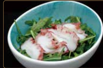
51. TAKO SALAD insalata di polipo* e rucola con salsa dello chef € 6,00