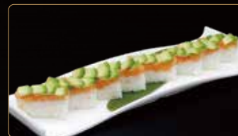
128. SAUDADE SALMONE rettangolo di riso esterno tartar di salmone avocado e teriyaki € 10,00