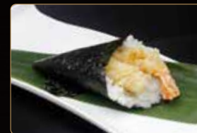
152. T. EBITEN € 4,00 gamberi* fritti spicy maionese teriyaki