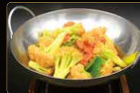
344. SCODELLA DI CAVOLFIIORE € 7,00