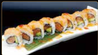
117. VOLCANO ROLL salmone avocado esterno tartar di salmone piccante salsa agropiccante € 12,00