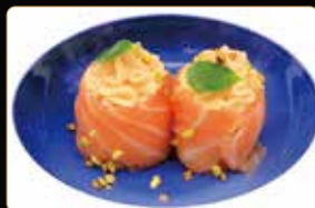
192. GIO SPICY PHILADELPHIA spicy philadelphia granelle di pistacchio riso esterno salmone € 5,00