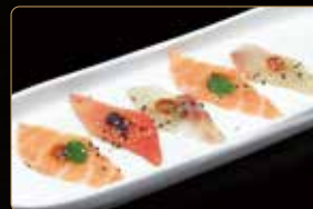
224. CARPACCIO MISTO SPRITZ € 8,00 carpaccio misto in salsa sumiso e sesamo