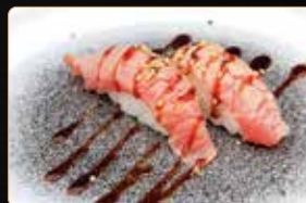
180. NIGIRI NIKU FLAMBÈ manzo scottato e teriyaki sesamo € 5,00