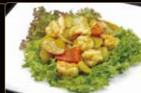
327. GAMBERI AL CURRY gamberi curry alcoco € 6,00