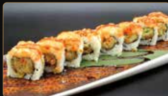
118. HANA ROLL tempura di fiori di zucca ripiena di gamberi* esterno tartar di samone e fiori di zucca fritto e salsa teriyaki € 10,00