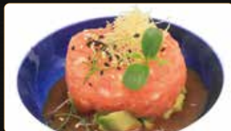
274. TARTAR SALMON SPRITZ tartar di salmone con salsa sumiso e sesamo € 10,00