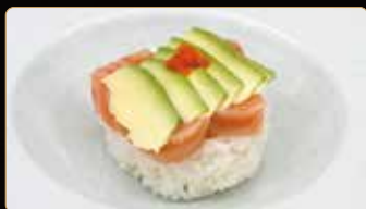
260. CHIRASHI SAKEDON € 14,00 ciotola di riso coperto di salmone crudo avocado sesamo