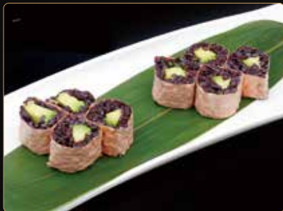
61. HOSOMAKI PINK AVOCADO riso venere e avocado esterno foglia di soia € 6,00