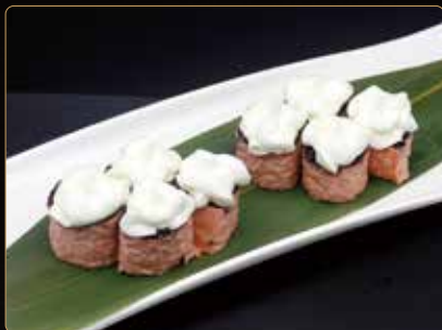
60. HOSOMAKI PINK SAKE riso venere e salmone esterno foglia di soia e philadelphia € 6,00

rotolino di riso con foglia di soia esterno - 8pz