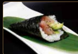
151. T. MAGURO AVOCADO tonno avocado € 4,00