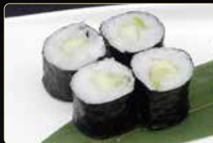
69. HOSOMAKI KAPPA € 3,50 cetrioli