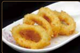
377. IKA FRAI € 6,00 anelli di totano fritto