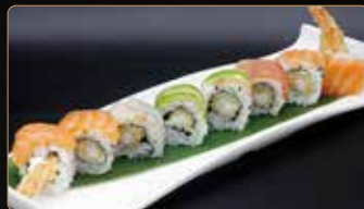
119. SNEAK FANTASIA gamberi* fritti maionese esterno pesce mix avocado teriyaki € 12,00