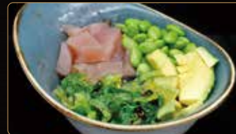
251. TUNA POKE € 10,90 tonno avocado edamame goma wakame sul lettino di riso venere