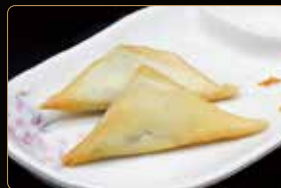
04. SAMOSA involtino con puré di patate al curry € 3,00