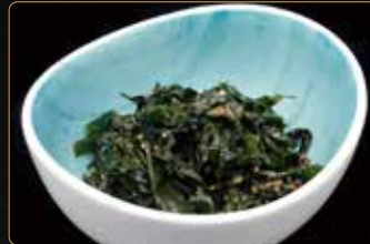
53. INSALATA DI WAKAME alghe wakame con salsa sesamo € 3,50