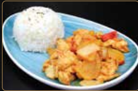
293. CURRY RICE € 9,00 riso con sugo di pollo al curry