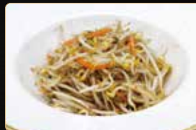
330. GERMOGLI DI SOIA SALTATA € 4,00