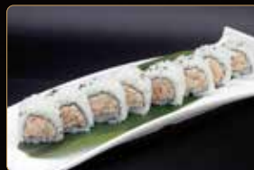
83. U. MIURA € 7,00 salmone cotto con philadelphia teriyaki