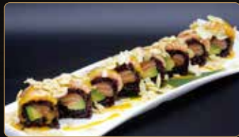
133. BLACK SAKE AVOCADO salmone avocado esterno salmone mandorle salsa mango € 10,00