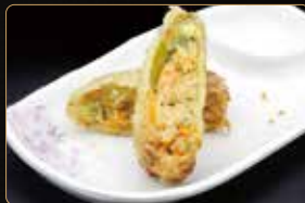
376. TEMPURA FIOR DI ZUCCA € 8,00 fior di zucca riempita di tartar di gamberi' e verdure fritto