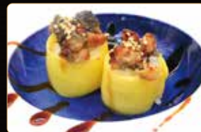
204. GIO UNAGHI € 7,00 tartare di unaghi riso avvolto da mango salsa kabayashi