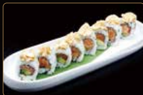
82. SPICY SALMONE AVOCADO € 7,00 salmone avocado esterno spicy philadelphia