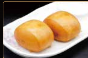
34. PANE AL VAPORE € 2,50 pane in latte al vapore 35. PANE FRITTO € 2,50 pane in latte fritto