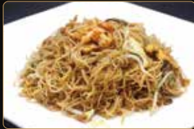
288. SPAGHETTI DI RISO spaghetti di riso con gamberi* e verdure € 6,00