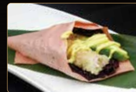
159. T. BLACK ANGEL riso venere gamberi* fritti avocado salsa allo zaferano teriyaki € 4,00