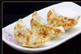
36. TEPPAN GYOZA € 4,00 ravioli di carne alla piastra