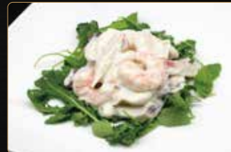
57. INSALATA DI MARE € 6,00 insalata di mare* misto con salsa dello chef