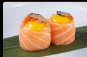
194. GIO GUAGLIA € 7,00 uova di quaglia, carpaccio di tartufo riso, salmone esterno salsa ponzu