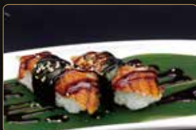
178. NIGIRI UNAGHI anguilla* e riso teriyaki € 5,00