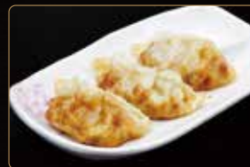
37. GYOZA FRITTO € 4,00 ravioli di carne e verdure mix fritto