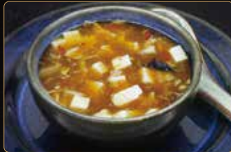
41. ZUPPA PECCHINESE € 3,50 zuppa di tofu, carne, funghi, aglio, cipollotti, zenzero, peperoni