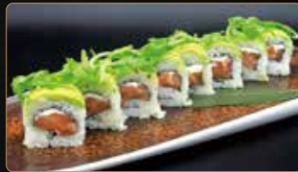
111. RUCOLA ROLL salmone philadelphia esterno avocado rucola € 10,00