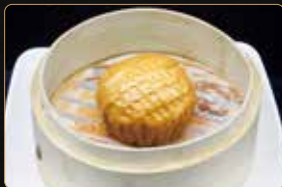
31. BAO WALNUT € 5,00 bao con dentro crema di latte e granelle di noci