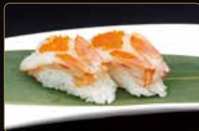
175. NIGIRI AMAEBI gamberi* crudi e riso € 3,50