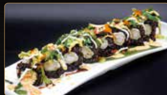
131. TIGER PLUS gamberi* fritti philadelphia esterno gamberi cotti* gomawakame* tobiko salsa spicy maionese teriyaki € 14,00