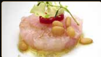
273. TARTAR RICCIOLA ricciola tritato piccante avocado tobiko kataifi salsa ponzu sesamo € 8,00