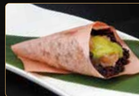
158. T. BLACK SPICY SAKE riso venere tartar di salmone salsa allo zaferano € 4,00