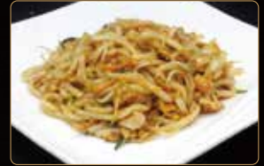
286. YAKI UDON € 7,00 spaghetti di grano grosso con gamberi* e verdure