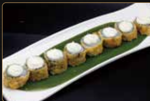
76. HOSOMAKI FRITTO € 6,00 salmone esterno fritto philadelphia teriyaki