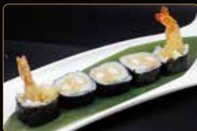
141. FUTOMAKI EBITEN gamberi* fritti maionese esterno kataifi e salsa teriyaki € 8,00