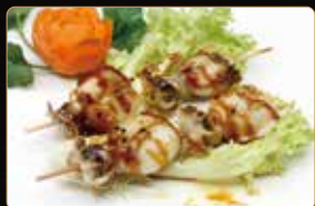
356. SPIEDINI DI SEPIE' € 6,00