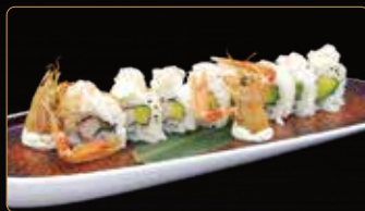
100. LANGOUSTINE ROLL surimi* avocado carpaccio di scampi* esterno € 14,00