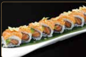
91. SALMON ROLL salmone avocado esterno salmone mandorle € 10,00