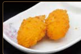
05. CHELE DI GRANCHIO* € 4,00