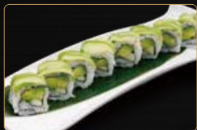
90. U. VEGETARIANO insalata avocado cetriolo sopra avocado € 9,00