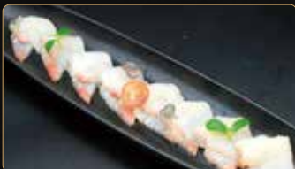
214. CARPACCIO RICCIOLA ricciola salsa ponzu € 8,00