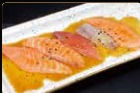
221. CARPACCIO MIX 5PZ salmone branzino tonno salsa ponzu sesamo € 8,00