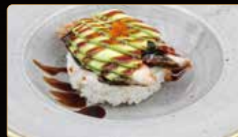
263. UNA DON € 15,00 ciotola di riso coperto di anguilla* avocado sesamo salsa teriyaki