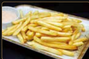
13. PATATINE FRITTE € 3,00