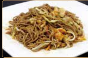
284. YAKI SOBA spaghetti di grano saraceno con gamberi* e verdure € 7,00