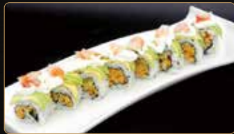
109. MAZARA ROLL fiori di zucca in tempura e avocado esterno philadelphia e gamberi mazara* € 12,00