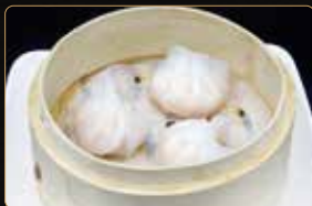
26. EBI GYOZA* € 4,00 ravioli di gamberi