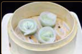
21. RAVIOLI DI EDAMAME edamame con olio di tartufo € 5,00