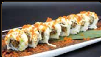
113. SOFT SHELL CRAB ROLL pregiatissimo granchio morbido in tempura esterno maionese teriyaki tobiko € 14,00