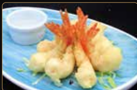
323. GAMBERI* AL LIMONE gamberi fritti con salsa limone € 6,00