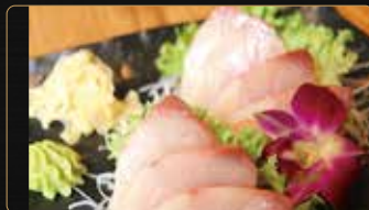
215. SASHIMI RICCIOLA € 6,00