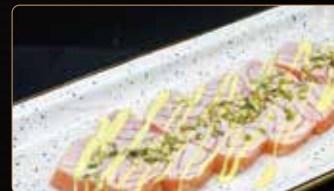
217. SASHIMI SCOTTATO sashimi di salmone scottato con salsa mango e scaglie di pistacchi € 7,00