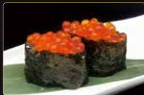
202. GUNKAN IKURA € 4,50 uova di salmone riso esterno alga