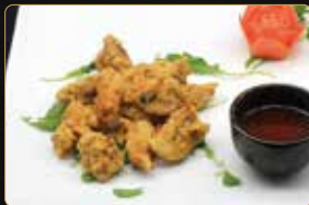
372. KARE KARAAGE € 7,00 fette di coscia di pollo fritto con impanatura al curry e sesamo