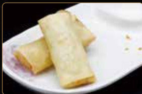
02. HARUMAKI* involtini con verdure mix 2pz € 3,00