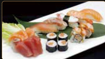
243. SUSHI SASHIMI MISTO € 12,00 3 nigiri, 2 uramaki, 2 hosomaki, 6 sashimi