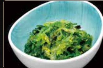
54. GOMAWAKAME alghe piccanti marinate con sesamo € 4,00