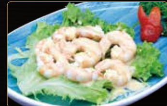
58. COCKTAIL DI GAMBERI* € 6,00