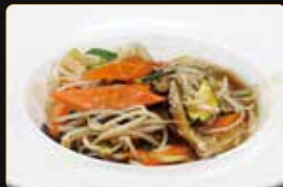
329. VERDURE MISTE SALTATE € 4,00 germogli di soia funghi carote zucchine