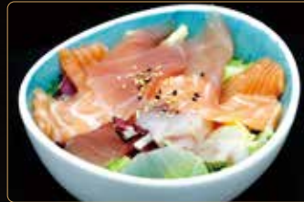
50. SASHIMI SALAD insalata mix con pesce crudi mix con salsa ponzu € 7,00