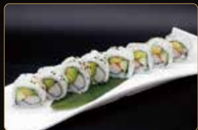
85. U. CALIFORNIA surimi di granchio*, avocado, cetriolo, maionese € 7,00