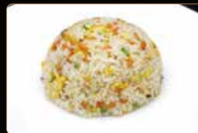
306. YAKIMESHI € 5,00 riso saltato con verdure miste