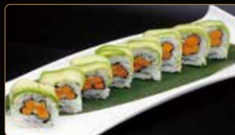
115. ZUCCA ROLL tempura di zucca esterno avocado e salsa teriyaki € 10,00