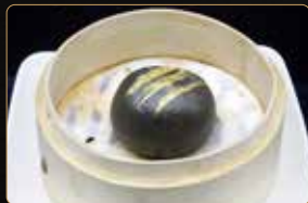
30. BLACK TARO BAO € 5,00 bao di carbone vegetale ripieno di