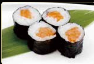
65. HOSOMAKI SAKE € 4,00 salmone