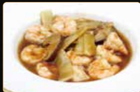
326. GAMBERI* BAMBÙ E FUNGHI € 6,00