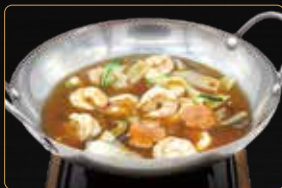
341. SCODELLA DI GAMBERI* E VERDURE MISTE € 7,00